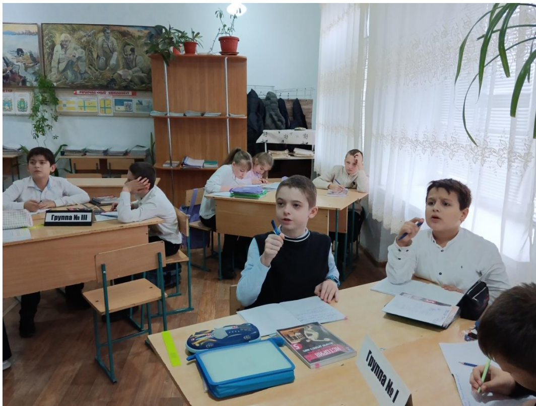
Обучающиеся 5 Б класса