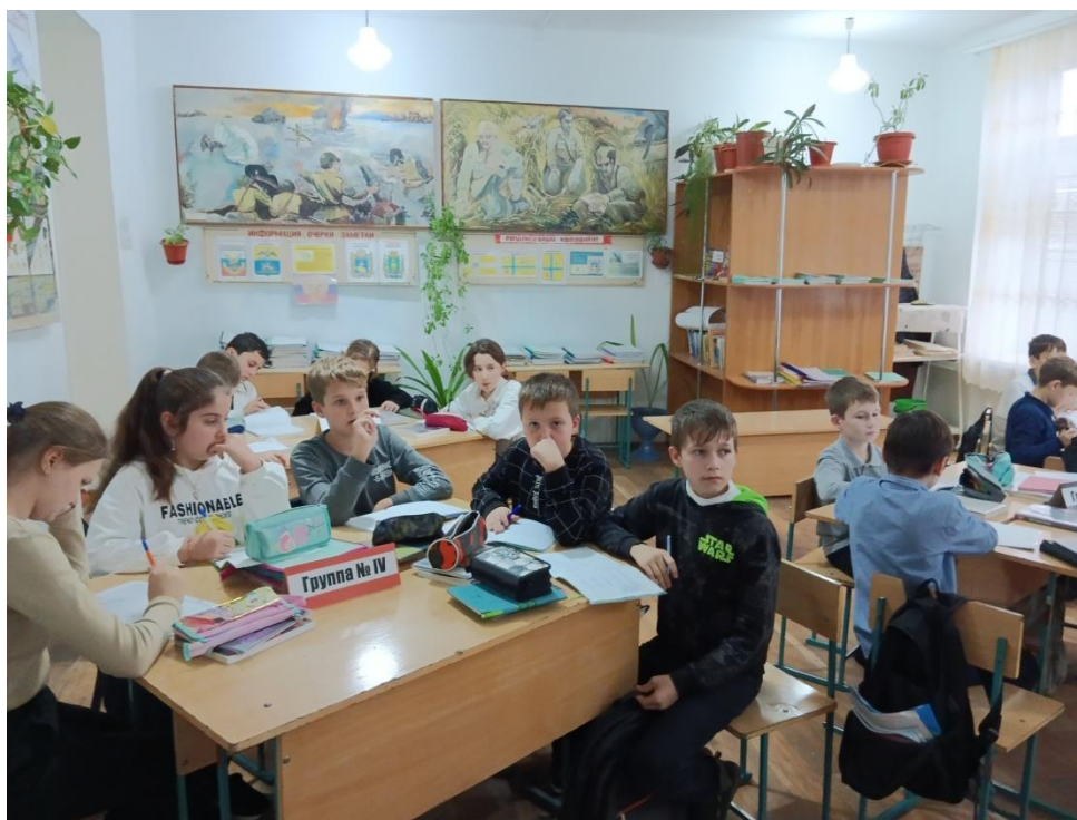
Обучающиеся 5 А класса